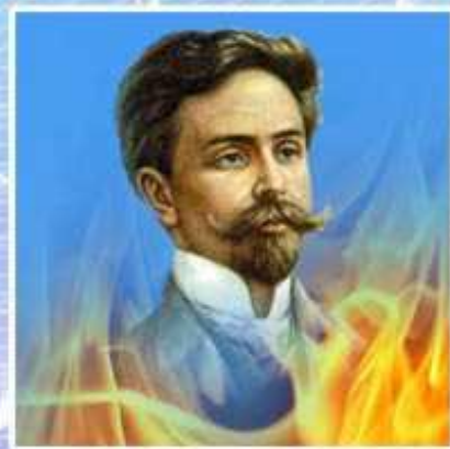
А. Н. Скрябин