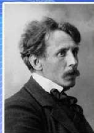
М. К. Чюрленис