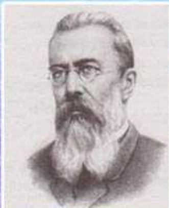
Н. А. Римский - Корсаков