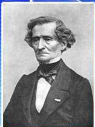
Г. Л. Берлиоз